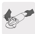
Operación a dos manos