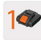
Incluyen bateía ion litio