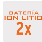
Más tiempo de vida Mayor velocidad de carga