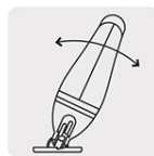
Cortes a 15°, 30° y 45° por ambos lados